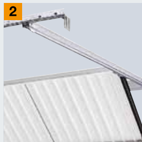
Направляюча шина на стелі