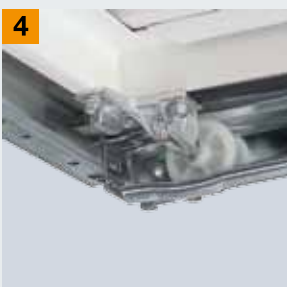
Паз для ходового ролика