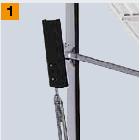
Захист від защемлення пальців